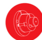
Klembussystemen, lasnaven en naafplaten