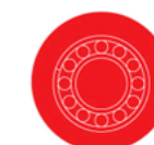
Lagers en lagerblokken