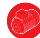
Electromotoren, motor-spanrails en sleden