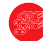
Ketting, ketting-wielen en toebehoren