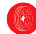
V-riemschijven en tandriemschijven