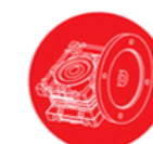
Tand- en worm-wielreductiekasten